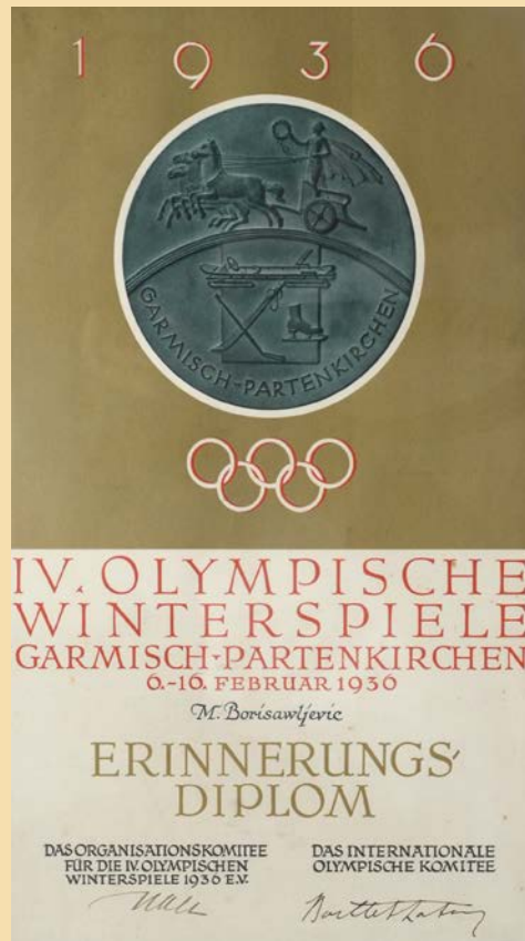
Диплома Организационог олимпијског комитета са Зимских олимпијских игара 1936. године