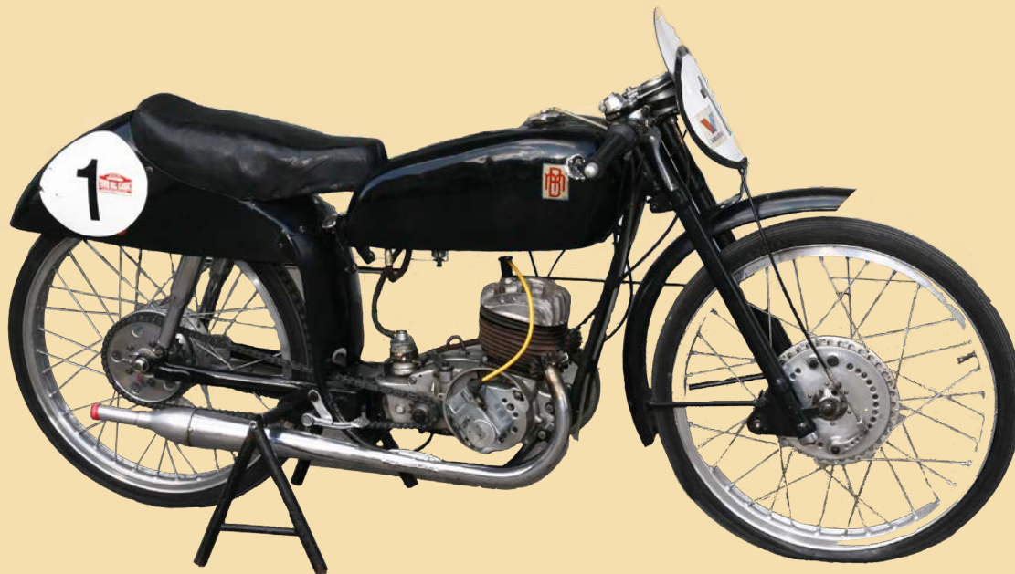
Први српски тркачки мотоцикл МБ 125