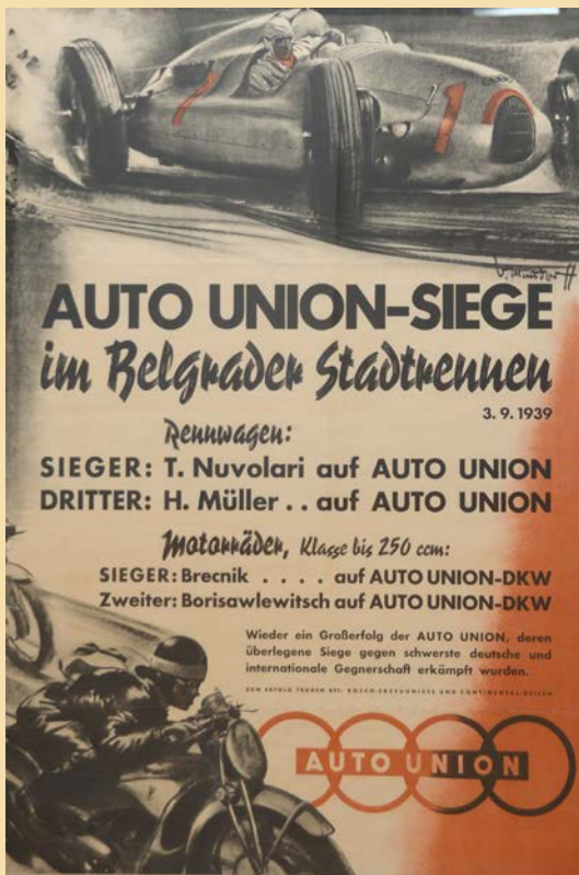
Плакат Ауто-Униона за велику трку Београда, 3. септембар 1939. године

Најпознатији путнички модели које је произвела ова фабрика су застава 750 (фића), застава 1300 (тристаћ), застава 101 (кец, стојадин) и југо 45. „Српски Детроит“ је доживео највећи успех 1989. године, када је произведено укупно 230.569 путничких и привредних возила.