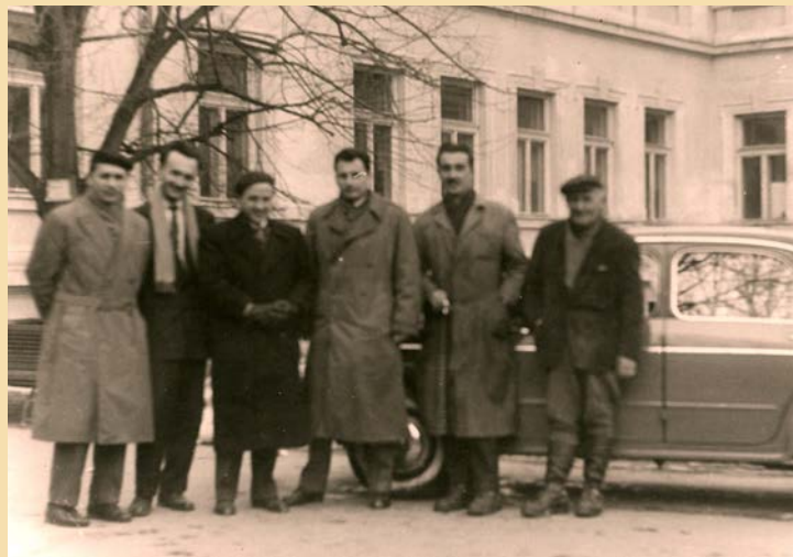
Преузимање FIAT-а у Црвеној застави у Крагујевцу, 1954. године