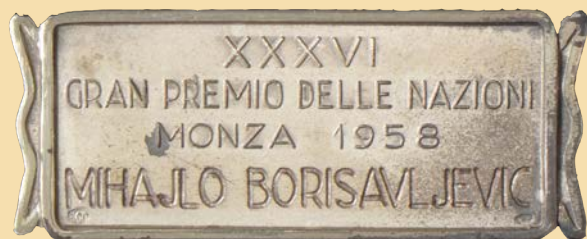
Плакета из Монце, 1958. година