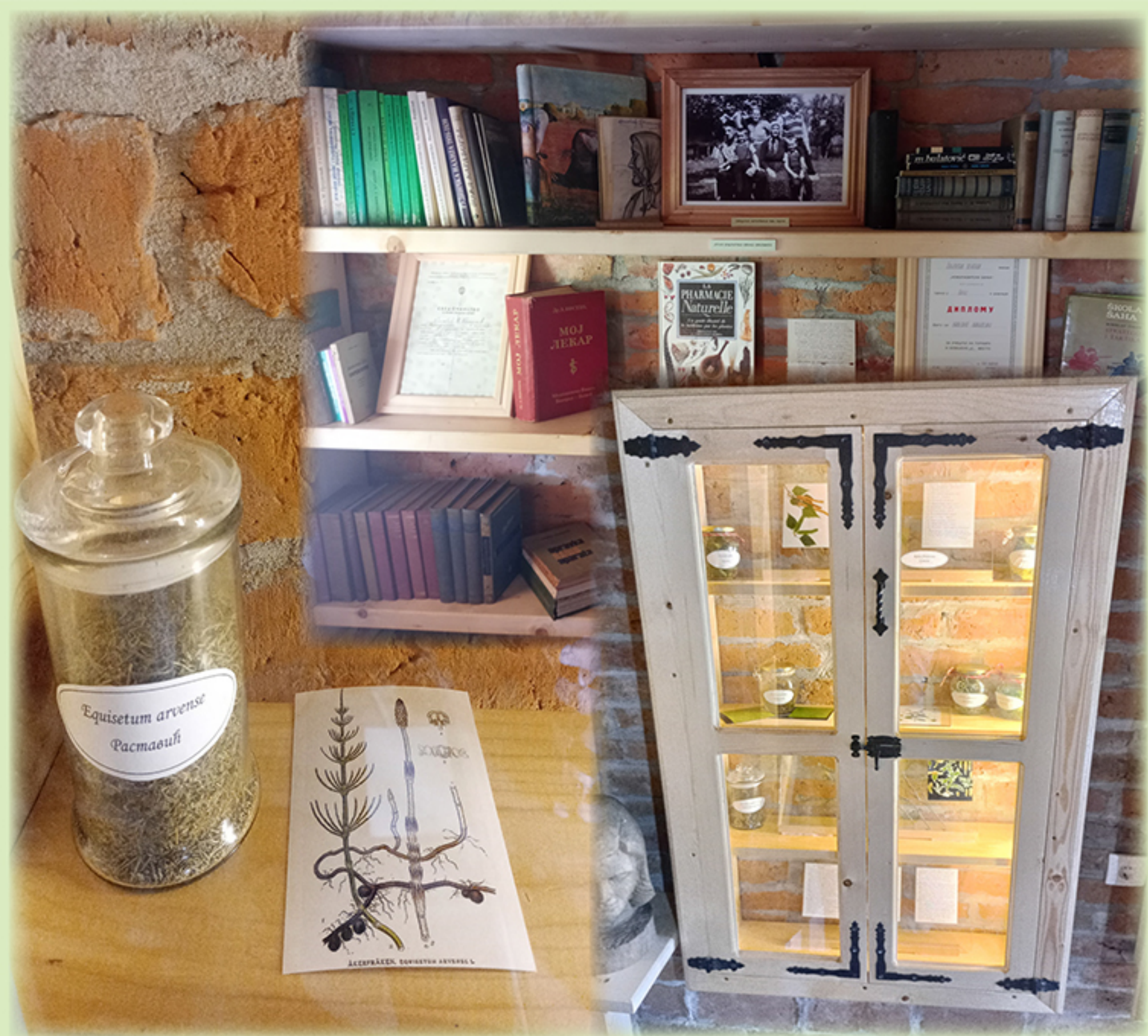
Део изложбене поставке Музеја Бранка Браловића