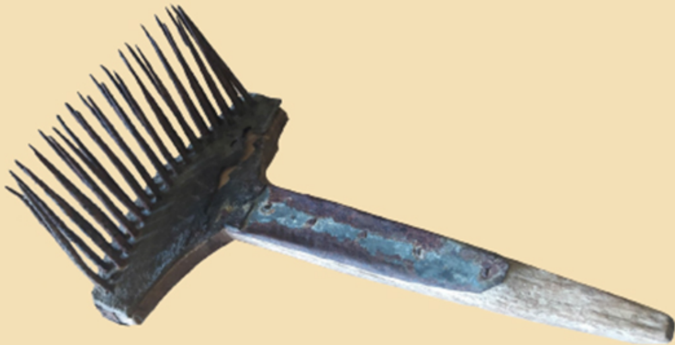
Гребен за вуну из 1952. године