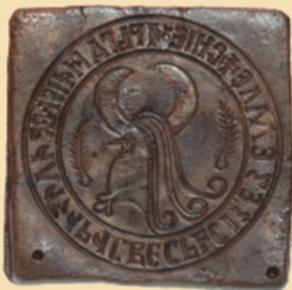
Типар Кнеза Лазара

туре приближава млађој публици. Као један у низу едукативних програма је и пројекат „Моје наслеђе – мој понос“ којим смо желели да истакнемо значај очувања и неговања културног наслеђа. Кроз презентацију „Моје наслеђе - мој понос“ ученици ОШ „Свети Сава“ у Горњем Милановцу су се упознали са културним наслеђем општине Горњи Милановац чији „чувар“ је наш Музеј. Ученици су преузели улогу кустоса и предмет који су наследили од предака, поштујући музеолошке принципе завели и обрадили у картоне предмета. Изложбом „Моје наслеђе – мој понос“ деца, наставници и Музеј рудничко-таковског краја истичу важност очувања културног наслеђа за добро свих нас.