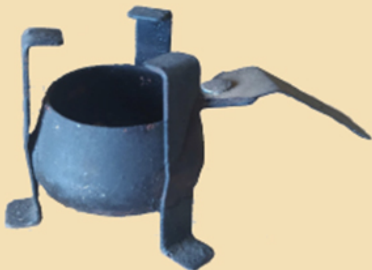
Плински горионик, XX век