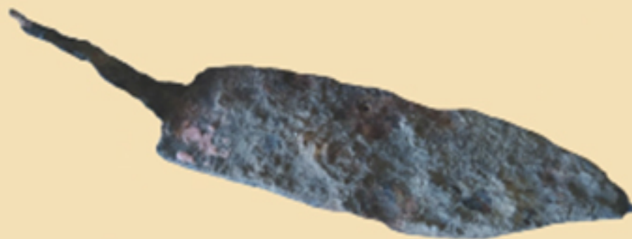
Оруђе из римског периода