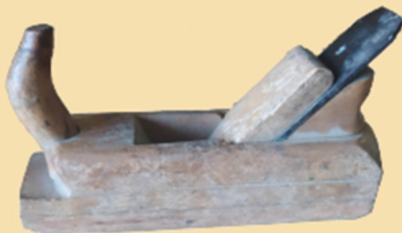
Ручно ренде за дрво