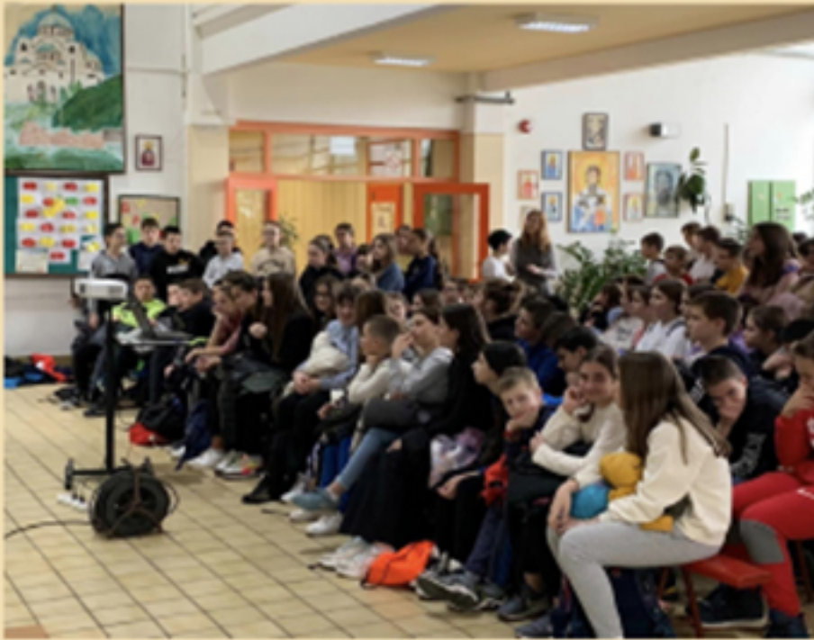
Ученици ОШ "Свети Сава"