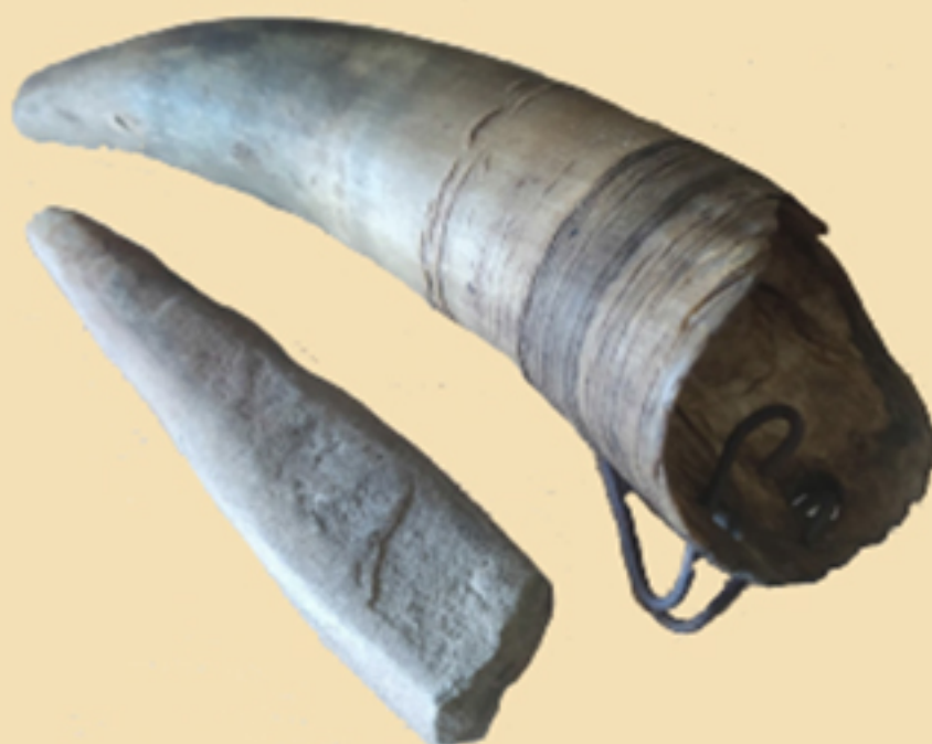
Рог за белегију, XX век