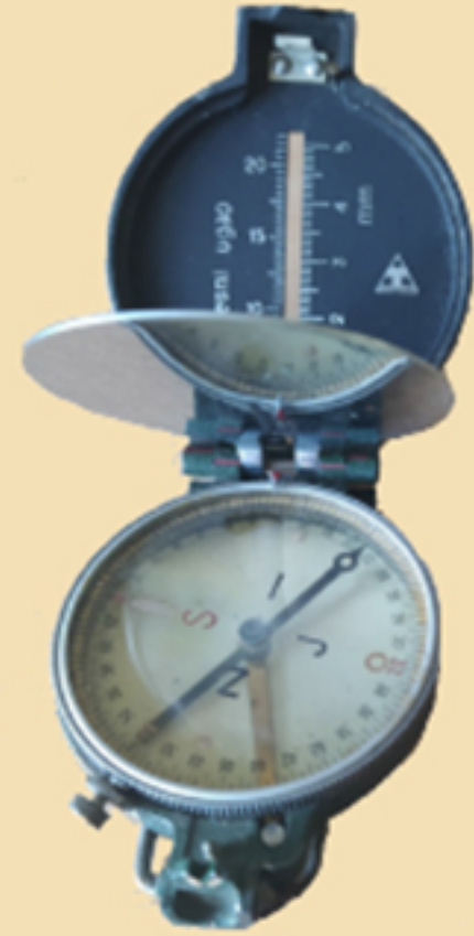
Бусола – компас, XX век