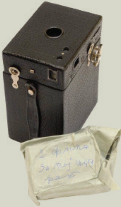
Фото-апарат мати Ане којим је забележила историју „Богдаја“ и других хранилишта