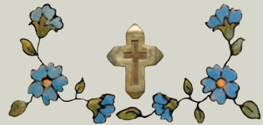
Илустрација представља крст којим је мати Ана благосиљала, и цетове које је осликавала на репродукцији иконе Покрова Пресвете Богородице