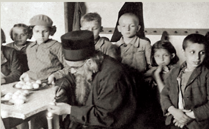
Владика Николај Велимировић са децом у једном од хранилишта

Издавачи: Народна библиотека Осечина Музеј рудничко-таковског краја