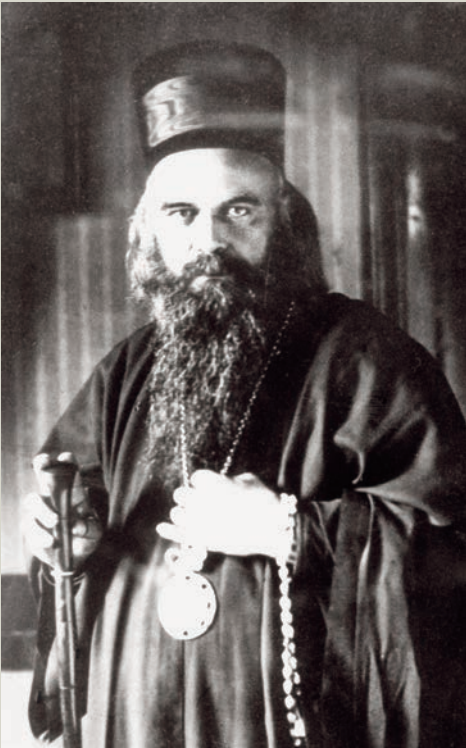
Владика Николај Велимировић

Највећи српски беседник, чије речи су биле и остају отрежњење српског народа, духовни родитељ владика Николај Велимировић, мудрост није стицао само образовањем и литературом коју је читао, већ у разговору са народом, а посебно са децом и старима. Дар да препозна богоугодне људе да их пригрли поукама, беседама, саборима, Николај је показао прихвативши Богомољачки покрет након Првог светског рата и борећи се за светосавско јединство цркве. Духовни циљ богомољца наликовао је строгим канонима монашког живота и личним канонима владике који је говорио да вера човекова није друго него отварање врата душе и допуштење Богу да уђе.