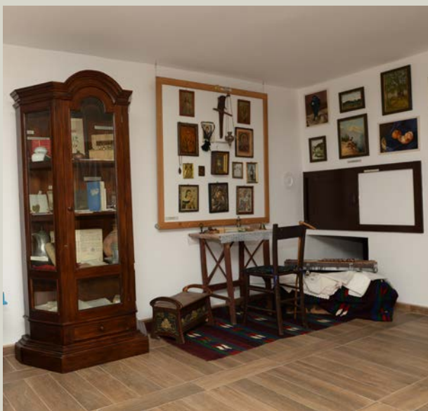
Детаљ спомен-собе у Манастиру Враћевшница