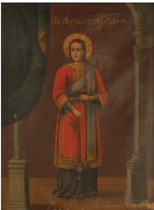
Сл. 15. Свети Архиђакон Стефан , непознати иконописац XIX века