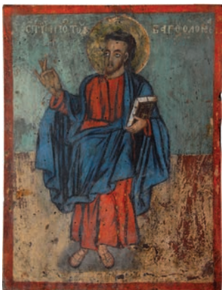
Сл.11. Свети Апостол Вартоломеј, непознати иконописац XIX века