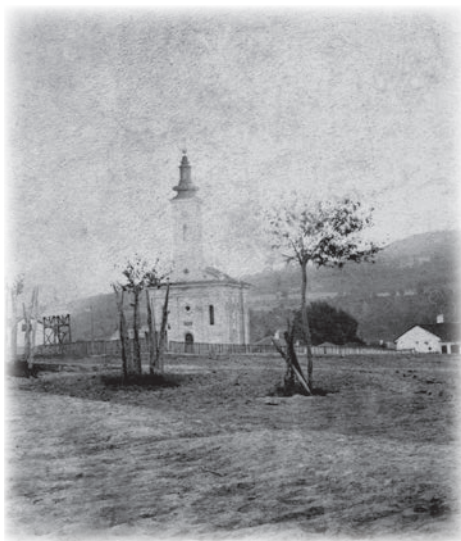
Најстарија фотографија цркве настала око 1865. године

Свакодневница овадшње богомоље није се пуно разликовала од других цркава. Испуњена људима и молитвама, њиховим надама али и стрепњама, делила је судбину средине којој је припадала. Упечатљивог изгледа, посебно је блистала у данима слава или честих визитација српских владара. С тим у вези, остаће забележено да је августа месеца 1865. године, приликом посете кнеза Михаила Горњем Милановцу и околини, настала и прва фотографија храма Свете Тројице. 19