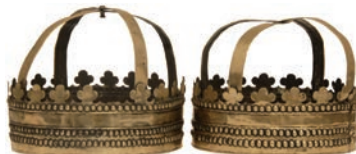
Сл. 20. Пар сребрних венчила из XIX века