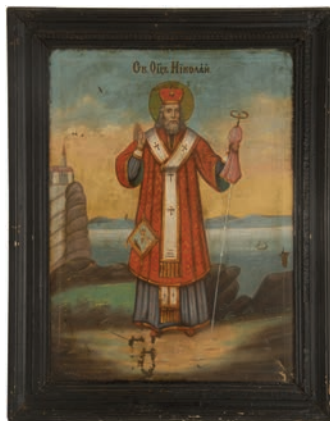
Сл. 14. Свети Отац Николај, непознати иконописац XIX века