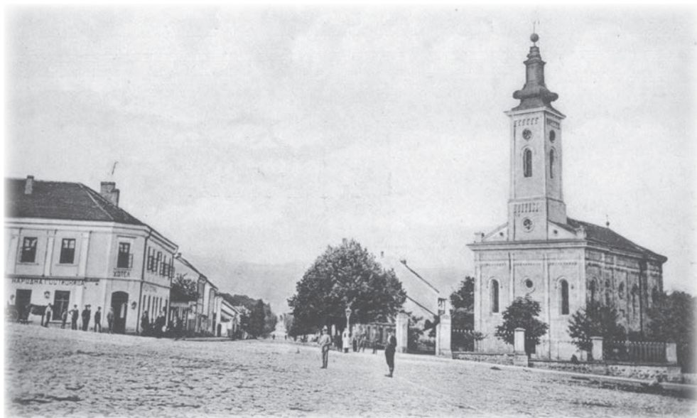
Изглед храма с почетка XX века

Смештен у доњем делу порте, Парохијски дом нестао је са лица земље почетком Другог светског рата. 21 Без обзира што данас нема пуно сачуване историјске грађе која ће детаљније сведочити о „кући цркве горњомилановачке“, један догађај са почетка XX века остао је забележен, и као такав, вредан је да се помене. Наиме, септембра месеца 1903. потписан је уговор између цркве и Округа рудничког по коме је зграда Парохијског дома издата на три године команди X пешадијског пука за укупну суму од 3420 динара. 22