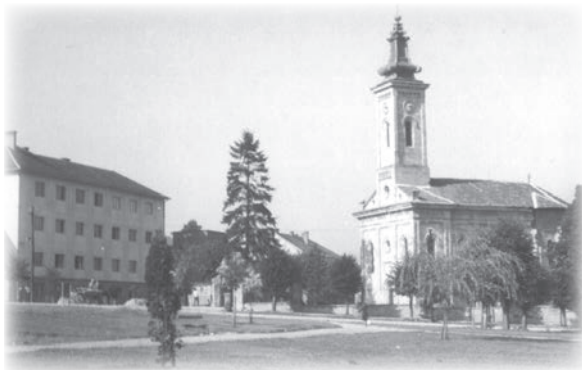
Милановачка светиња после II светског рата

„поновног васпостављања наше патријаршије.“