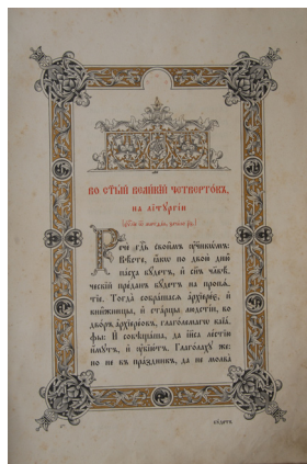
Сл. 22. Јевангелија штомаја, Москва, 1900.