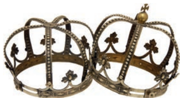
Сл. 19. Пар венчила из 1899. године