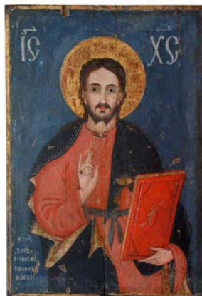
Сл. 8. Исус Христос, непознати иконописац XIX века