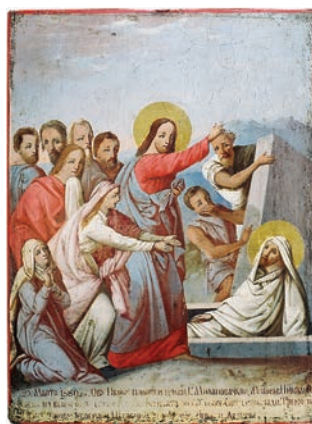
Сл. 6. Васкрсење Лазарево, Димитрије Посниковић, 1889.