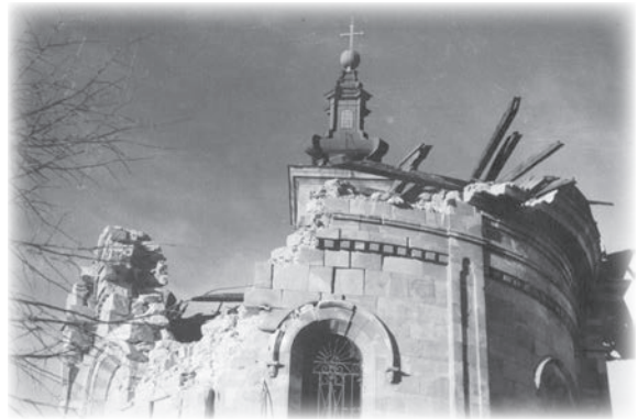
Олтарски простор непосредно после бомбардовања

Потпуна санација црквеног објекта обавиће се у неколико фаза током шесте деценије XX века. Планирани радови подразумевали су замену крова на звонику, обнову западног дела цркве, унутрашње малтерење, односно кречење, као и лепљење камена на олтарском зиду. Када је 1960. уместо црепа поново постављен, заједно са олуцима, нови лим, милановачки храм је, барем што се спољашности тиче поново задобио свој