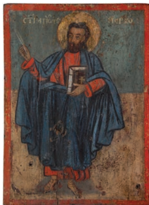
Сл. 12. Свети Апостол Марко, непознати иконописац XIX века