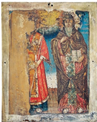
Сл. 3. Икона са представом два светитеља, Сретен Протић, 1833.