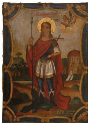
Сл. 4. Свети Великомученик Георгије, непознати иконописац, 1858.