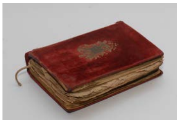
Сл. 21. Службеник, Санкт Петербург, 1882.