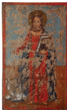
Сл. 10. Свети Јеванђелист Лука, непознати иконописац XIX века