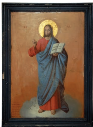
Сл. 5. Исус Христос, Димитрије Посниковић, 1888.