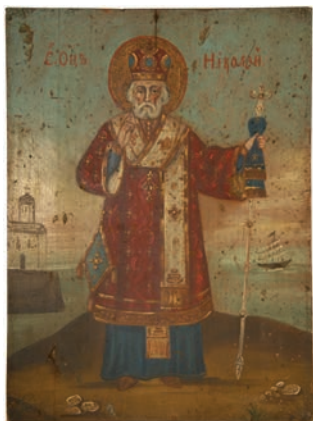
Сл. 13. Свети Отац Николај, непознати иконописац XIX века