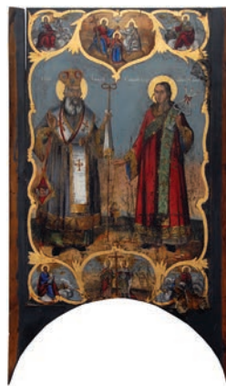
Сл. 18. Свети Атанасије и Свети Стефан