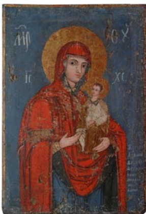
Сл. 9. Богородица са Христом, непознати иконописац XIX века