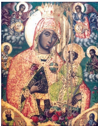
Сл. 7. Богородица „Ружа која не вене“ рад непознатог мајстора, друга половина XIX века