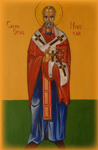
Свети отац Николај