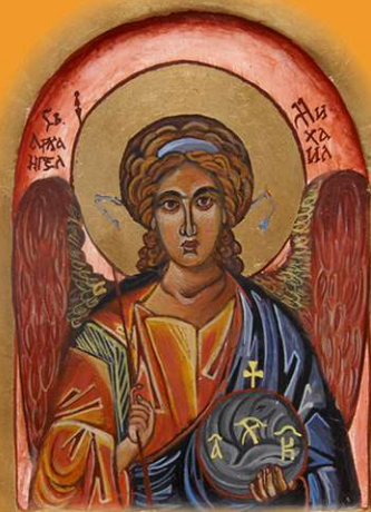
Свети архангел Михаило