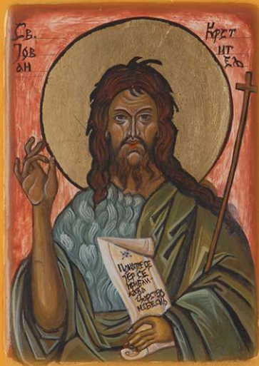
Свети Јован крститељ