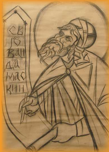
Свети Јован Дамаскин